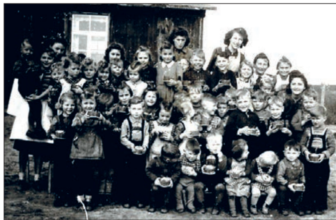
Abb. Ostern 1948